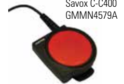
Savox C-C400 GMMN4579A

Vervollständigt wird diese Lösung durch das Savox C-C400 , das die Benutzung Ihres Zweiradfunkgeräts auch in gefährlichen Situationen ermöglicht. Die robuste und speziell für extreme Umgebungen entwickelte extra große PTT-Taste sorgt für eine zuverlässige Bedienung, auch unter Arbeits- und Schutzkleidung.