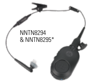
NNTN8294 & NNTN8295*

Die im Funkgerät integrierte Bluetooth 2.1 Audiofunktion ermöglicht eine schnelle und sichere Verbindung mit einer Vielzahl von Bluetooth-Zubehörteilen. Die einfach zu verbindenden Motorola Bluetooth-Zubehörteile verbessern die Leistung und Sicherheit Ihrer Mitarbeiter, wenn diese diskret und verdeckt arbeiten und sich ohne störende Anschlussleitungen fortbewegen müssen. Ein ganz neues Benutzergefühl wartet auf Sie.