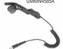
Savox HC-1 GMMN4585A

Das Savox HC-1 ist eine kompakte Helm-Kommunikationseinheit für Profis, welche unter gefährlichen Bedingungen arbeiten müssen. Sie lässt sich leicht in fast alle Helmtypen integrieren und bietet eine klare Freisprechverbindung, die ideal für Feuerwehrmänner und Rettungskräfte geeignet ist.